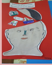
BLUE KAITONG – 2 ND