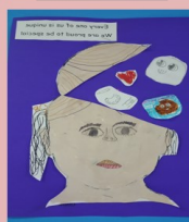
RED LAURA – 3 RD