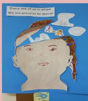
BLUE EVA - 2 ND