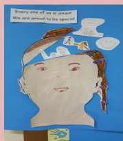
BLUE EVA – 2 ND