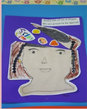
YELLOW YAYEE - 1 ST