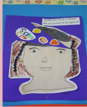
YELLOW YAYEE – 1 ST